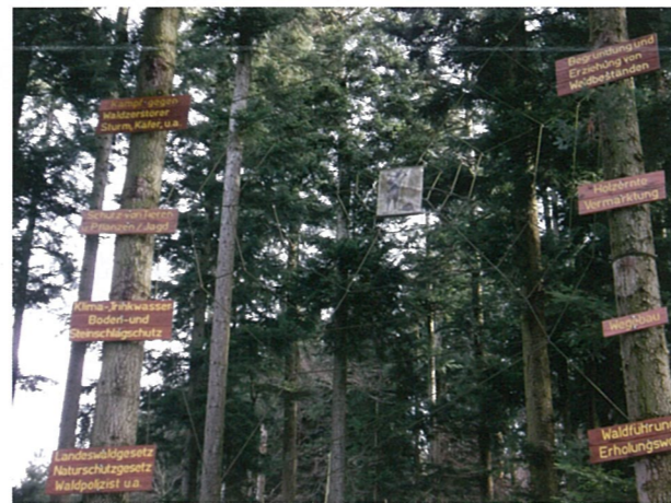
▲ ヴァルドキルヒ町 森林官(フォレストラー)を中心とした徹底した山の管理。 ドイツは国土の3割が森林、日本は7割でドイツの 2.5 倍あり恵まれた森林環境がありますが、ドイツの林業関連の雇用は 130 万人とも言われ(ドイツでは世界的に有名な基幹産業である自動車産業でも 75 万人)、日本では森はまだ活用できていないという現実を感じざるをえません。