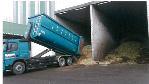
▲ オブリグハイム木質バイオマス発電所