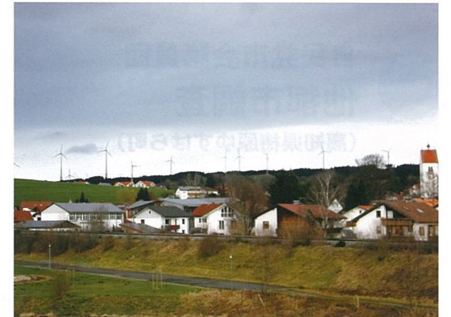
▲ エネルギー自立を目指すヴィルトポルツリート村の風力発電(電力自給率 500%)

日本でも原子力に対する信頼性の低下などから原子力を学ぶ学生は減っていくのではないかと危惧しています。現在、国においてエネルギー基本計画の見直し議論されていますが、将来、原発を維持するにしろ廃止するにしろ、原子力の専門家を一定数確保し続けていかなければ、日本は原子力に対して何もできなくなってしまいます。大学のまち京都だからこそ、大学や企業、国にも動きかけ、原子力技術に対す取組を進めていく必要があると考えます。