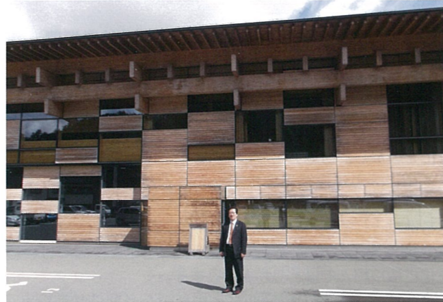
▲地元産木材の活用、大規模な太陽光発電システム、環境負荷抑制への配慮が行き届いた設計であるということで、サステナブル建築賞を受賞した梶原町総合庁舎

梶原町は四万十川の源流域に位置し、面積の9割を森林が占める人口約4,000人の町ですが、自然の力を活用し始めて約10年、四国カルストに設置した風車はその利益により太陽光発電の20戸に1戸の普及とCO 2 吸収源たる森林の約6,000haにわたる整備をもたらしました。また、公民協働での木質ペレット生産は、新たな資源循環の仕組みをつくりました。2050年迄に自然エネルギー自給率100%を目指しています。