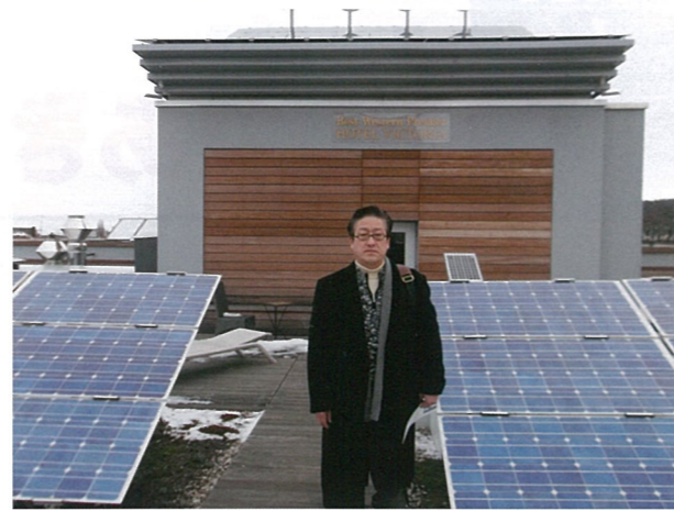
▲ エコホテル ヴィクトリアの太陽光パネル

京都市においては、ゴミ有料化財源を活用し、省エネ改修補助金を創設してはいかがでしょうか。ドイツ視察中の講義では、省エネ改修補助金については、1つの助成で 12 の民間投資を引き出すほど投資効果の高い補助金となっています。また、大手業者よりも小回りのきく中小業者に仕事が回ってくる分野なので、地域経済の活性化が期待できる点で本市にとっても効果的な政策であると考えます。