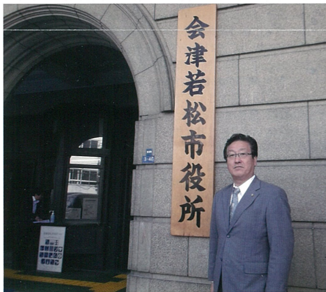
▲市会改革推進委員会他都市調査 (平成 25年 11月 1日)

また、議員の定数と報酬についてしっかりと検討を進め、27年度の統一地方選挙迄に改革してまいります。その中でも特に定数の削減は必須だと思えます。