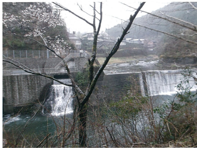
▲梶原川にあるわずか6mの落差を利用した小水力発電