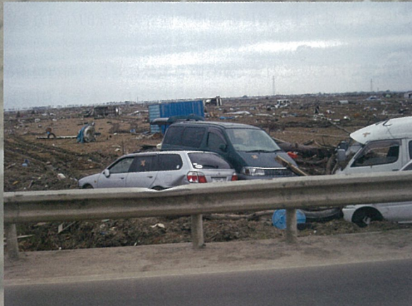
壊滅的な被害をうけた沿岸部