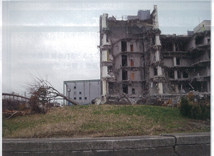
津波により崩壊した浄化センター