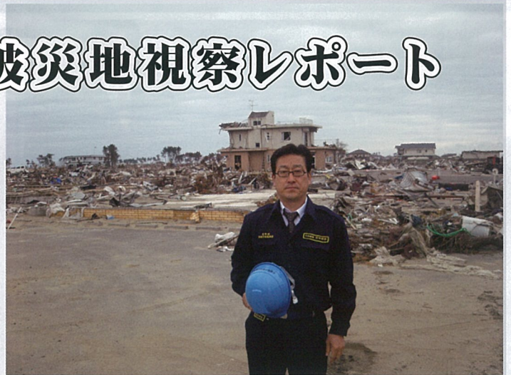
津波により失われたまち

京都市におきましても、大震災発生直後から消防局、上下水道局、保健福祉局、環境政策局等全庁あげて延べ1,097名(5/29現在)の職員が被災地に派遣されました。またこの5月議会でも306億円の補正予算を組み、オール京都で復興へ向けての支援をしております。